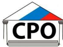
ООО «Сервисно- ремонтная компания»